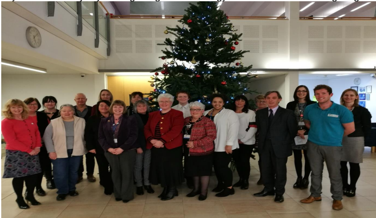
Yn y llun uchod y mae'r sawl a fynychodd y seremoni wobrwyo Hyfforddi'r Hyfforddwr y Rhaglen Cydnerthedd a Lles Gofalwyr ym mis Rhagfyr 2018.

Mae'r gwaith o ddatblygu brecwastau lles yn yr ysgol ynghyd â gwaith dylunio, yr adnoddau a gydgyhyrchwyd, deunyddiau cyrsiau, a chynlluniau cyflwyno a chyfathrebu wedi'u cwblhau erbyn hyn, a bydd y rhaglen yn cael ei chyflwyno mewn rhagor o leoliadau yn ystod 2019-20. Bydd arfer gorau a gwersi'n cael eu hystyried yn ystod 2019-20 gyda'r bwriad o gyflwyno'r rhaglen ar draws rhagor o sefydliadau a chymunedau a chyflwyno rhagor o geisiadau am gyllid o'r Gronfa Gofal Integredig.